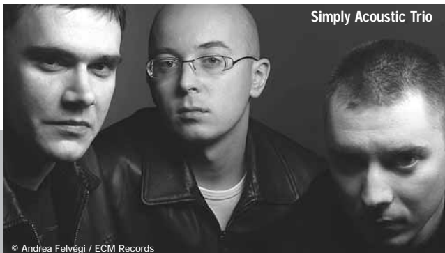
Simply Acoustic Trio