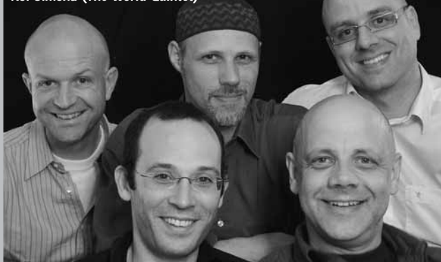
Kol Simcha (The World Quintet)

Die fünf virtuellen Musiker verbinden osteuropäische Musiktradition mit klassischen Elementen und Jazzimprovisationen und sprengen spielerisch musikalische Grenzen.